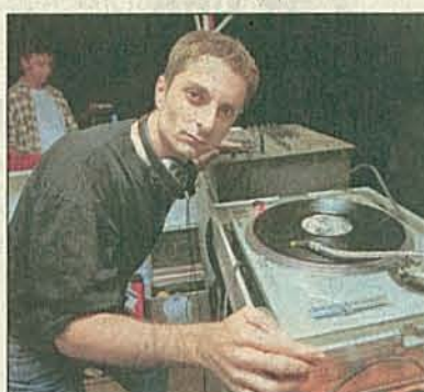
Sorgte für das intergalaktische Sound-Gemisch zum Abtanzen: Der Schweizer Star-DJ Gogo.

■ Tip: Wer die Party verpasst hat, kann sich ein wenig Vulkan-Stimmung nach Hause holen. Die Musik wurde auf eine CD (links) gebrannt. Titel: «Vulcano ExS».